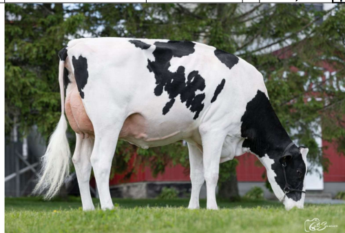
Dam: JM Valley Sidekick Lady