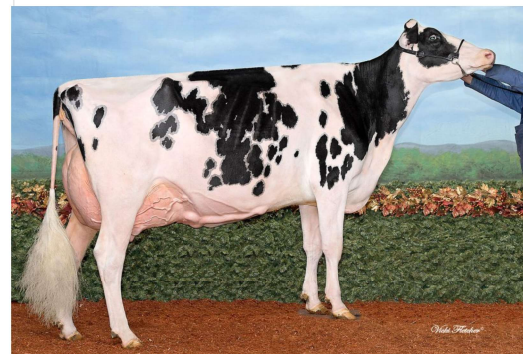
MM: Idee Windbrook Lynzi