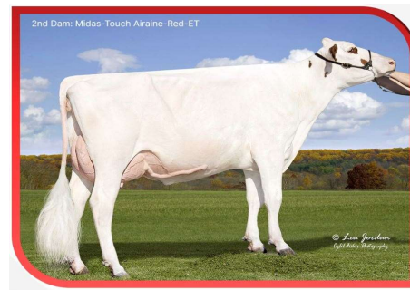
MM: Midas Touch Airiane Red EX 90