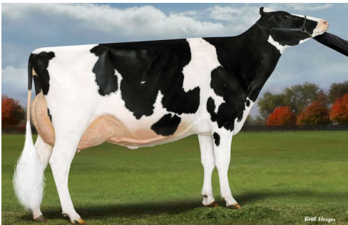
M: Ladyrose Caught Your Eye EX 92