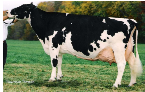
Stammoeder: Stookey Elm Park Blackrose EX 96