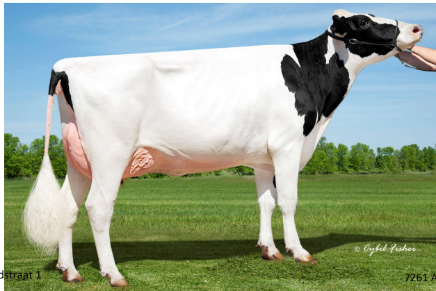
MMM; Speek NJ Joyful VG 85