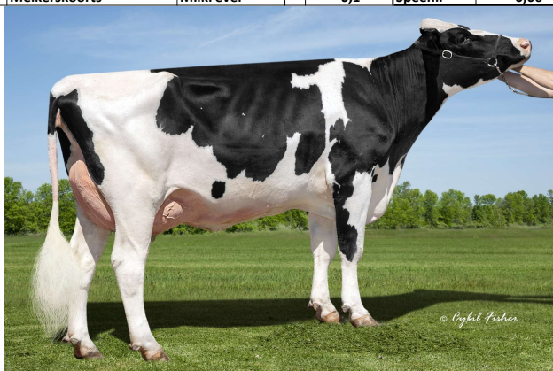
M: Dewgood 720-816 Cashier