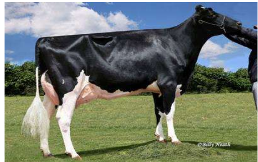
MMMMM: Ladys Manor Alanas Dora EX 93