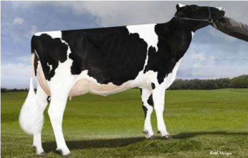
MMM: Ladys Manor S Dahlia VG 87