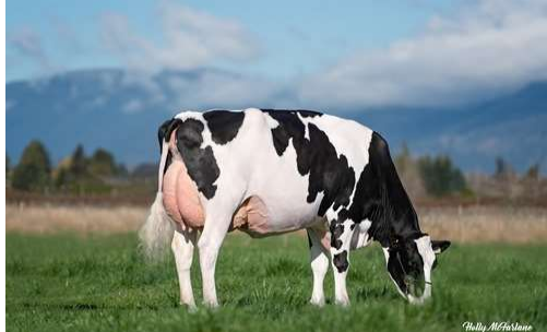
MM: Mistique Lambda Anis VG 89