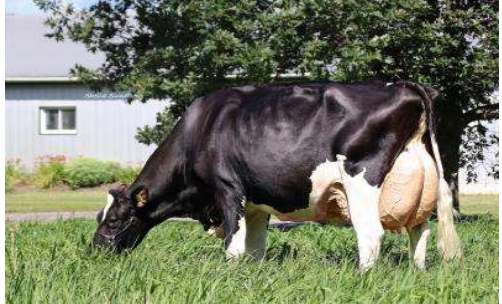
MMM: Mistique Extreme Abricot EX 94