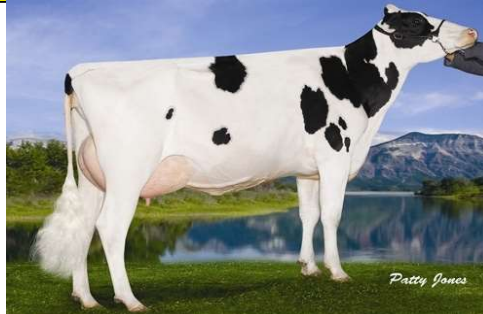
MMMMM: Donnaview A Planet Solo VG 88