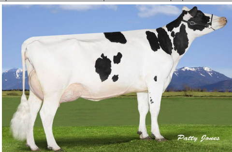
MMMM: Rockymountain Freddie Sydne VG 85