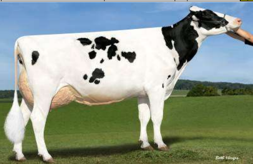
Dochter: Sandy-Valley Eternity EX 92