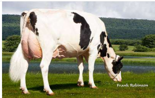
Dochter: Welcome-Tel Rubicon Pipa EX 94