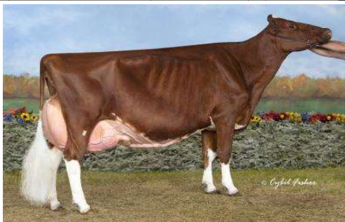
Stammoeder: KHW Regiment Apple-Red EX 96