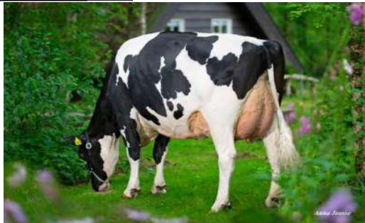
MMM: De Oosterhof Dg Rose VG 89