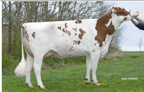
MM: Lakeside Ups Red Range VG 86