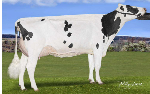
Volle Zus : Stantons Luster Move P VG 85