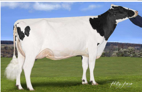
M: Stantons Bighit Maker GP 83