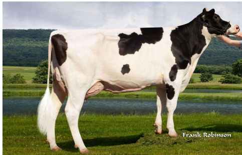
M: Fairmont Salvatore Doris VG 85