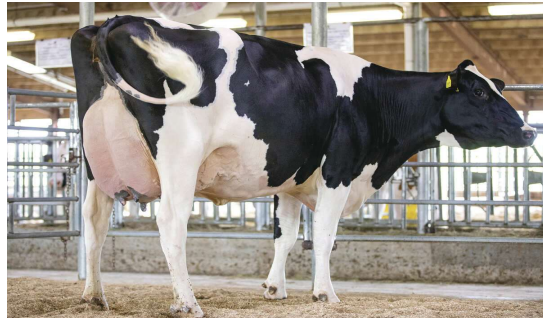
MM: Siemers Denver Paris EX 91