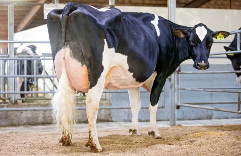
M: Siemers Lambda Paris EX 91