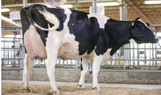
MM: Siemers Denver Paris EX 91