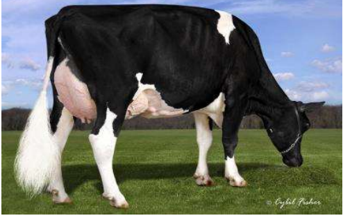
MMMM: View-Home Meridian VG 86