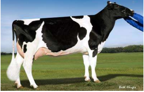
MMMMM: Pine Tree 2149 Robst VG 87