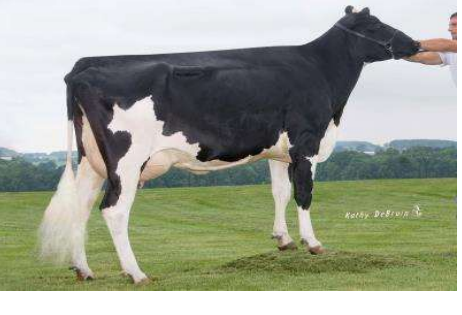
MMMMMM: Pine Tree Zenith Sheen VG 87