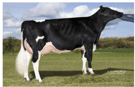
MM: Cookiecutter Dta Habitan EX 90