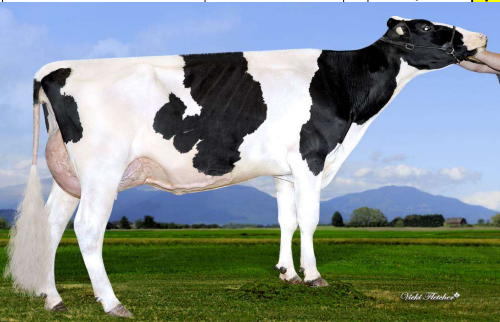
Moeder: Vogue Limelight Ever After PP