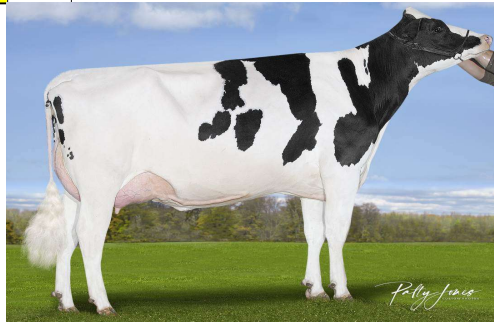
MM: Vogue Bighit Alie