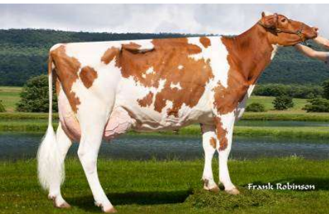
M: Danhof Alena Red GP 83