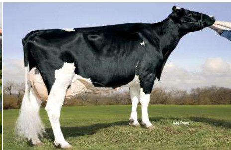
Stammoeder: Kamps Hollow Altitude EX 95