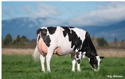
MM: Mystique Lambda Anis VG 89