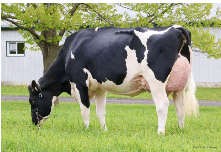
M: Mystique Rozume Anicet VG 87