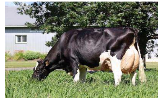
MMM: Mystique Extreme Abricot EX 94